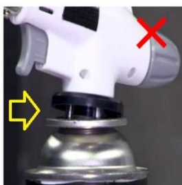
正しく接続されていない様子 (イメージ)

→ボンベホルダーの内側ガイドにカセットボンベの切り欠きを合わせずに斜めに挿入したとみられる傷が認められたことから、ガストーチとカセットボンベの接続が不完全な状態で使用されたことで、接続部から未燃ガスが漏れ、点火時の炎が引火した可能性が考えられます。