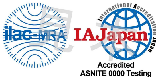
図1 ILAC MRA組み合わせ認定シンボル

備考:ILAC MRAマークはILACにより国際商標登録されている。(国際登録番号: 840857)