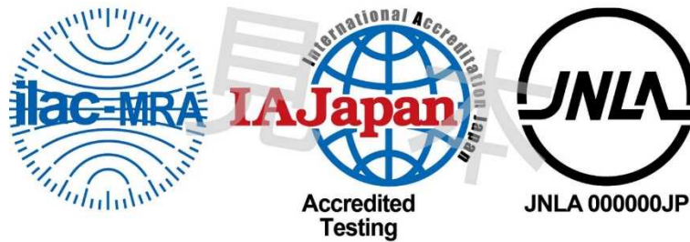
図1 ILAC MRA 組み合わせ認定シンボル

備考:ILAC MRA マークは ILAC により国際商標登録されている。(国際登録番号:840857)