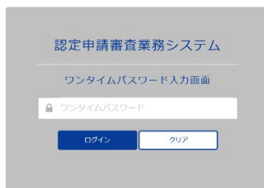
ワンタイムパスワード入力画面