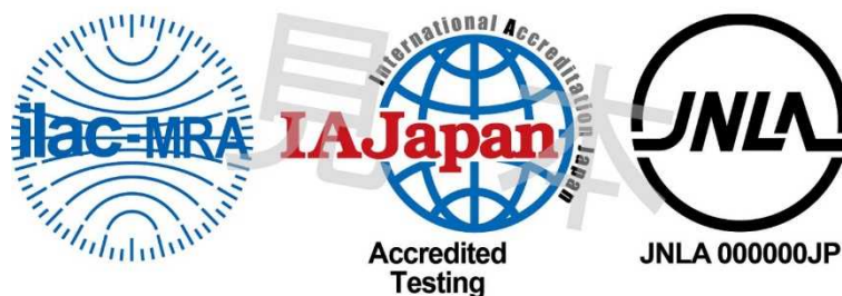
図1 ILAC MRA 組み合わせ認定シンボル

備考:ILAC MRA マークは ILAC により国際商標登録されている。(国際登録番号:840857)