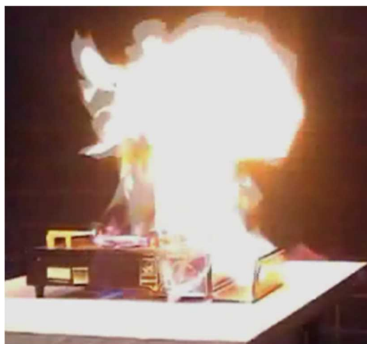
図1 カセットボンベと本体との結合部からのガス漏れによる爆発(再現実験より)

カセットボンベの切欠き(凹部)部とカセットこんろの容器受けガイド(凸部)をしっかりと合わせてください。合っていない場合、カセットボンベと本体との結合部から漏れたガスに引火して火災を引き起こすおそれがあります。(図1参照)