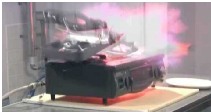
図3 ガスこんろの上にカセットこんろを置いた再現実験