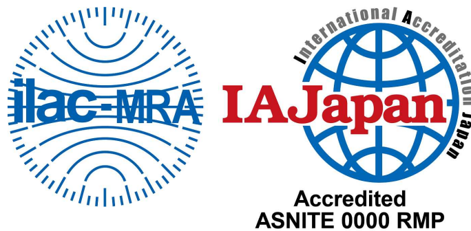
図1 ASNITE 標準物質生産者認定シンボル

認定事業者がその認定の地位を示すことに用いるために、IAJapanによって交付されるシンボル。認定機関ロゴに、認定識別を加えた一体のもので構成される。認定シンボルは認定事業者が発行するRM文書(“標準物質認証書”又は“製品情報シート”)に使用することができる(下図1参照)。