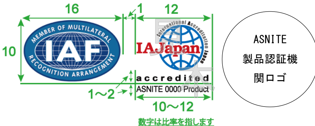
図 2 ASNITE/IAF MLA組み合わせ認定シンボルの使用例

※：認定センターはIAF MLAメインスコープ（製品認証）におけるIAF MLA署名認定機関であり、ASNITE/IAF MLA組み合わせ認定シンボルは、ASNITE製品認証機関ロゴと組み合わせて使用すること。