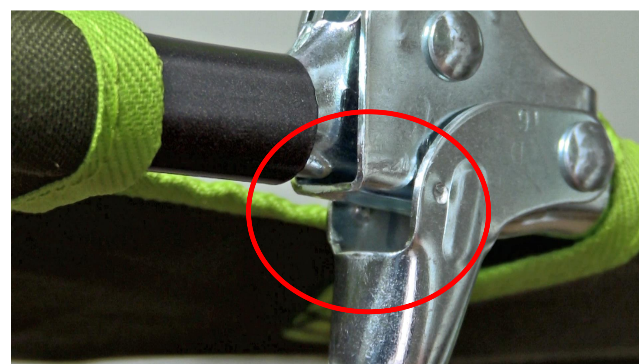
(写真) 手指を挟む箇所(例)

ベッドに腰掛けた拍子に折りたたみベッドの脚が展示台から落ち、そのはずみにフレームと脚の開き止め部にできた隙間に手指を挟んだ、または腰掛けた状態で座面を動かしたことで生じた隙間に手指を挟んだものです。