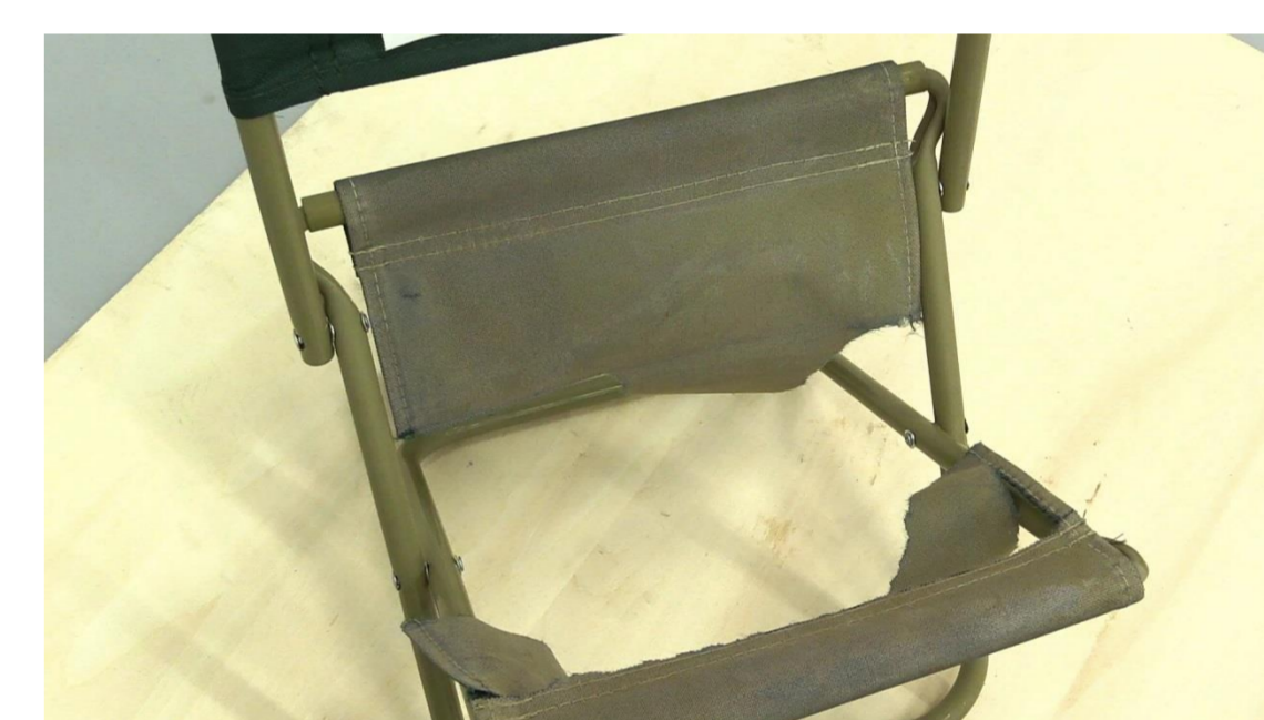
(写真) 劣化した座面に座って、座面が破れたイメージ