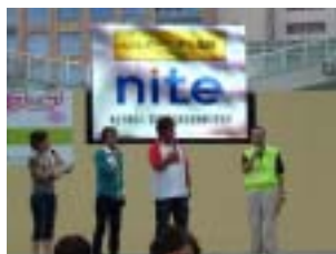
NITEステージイベントの様子