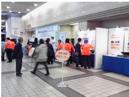
キャンペーンの様子