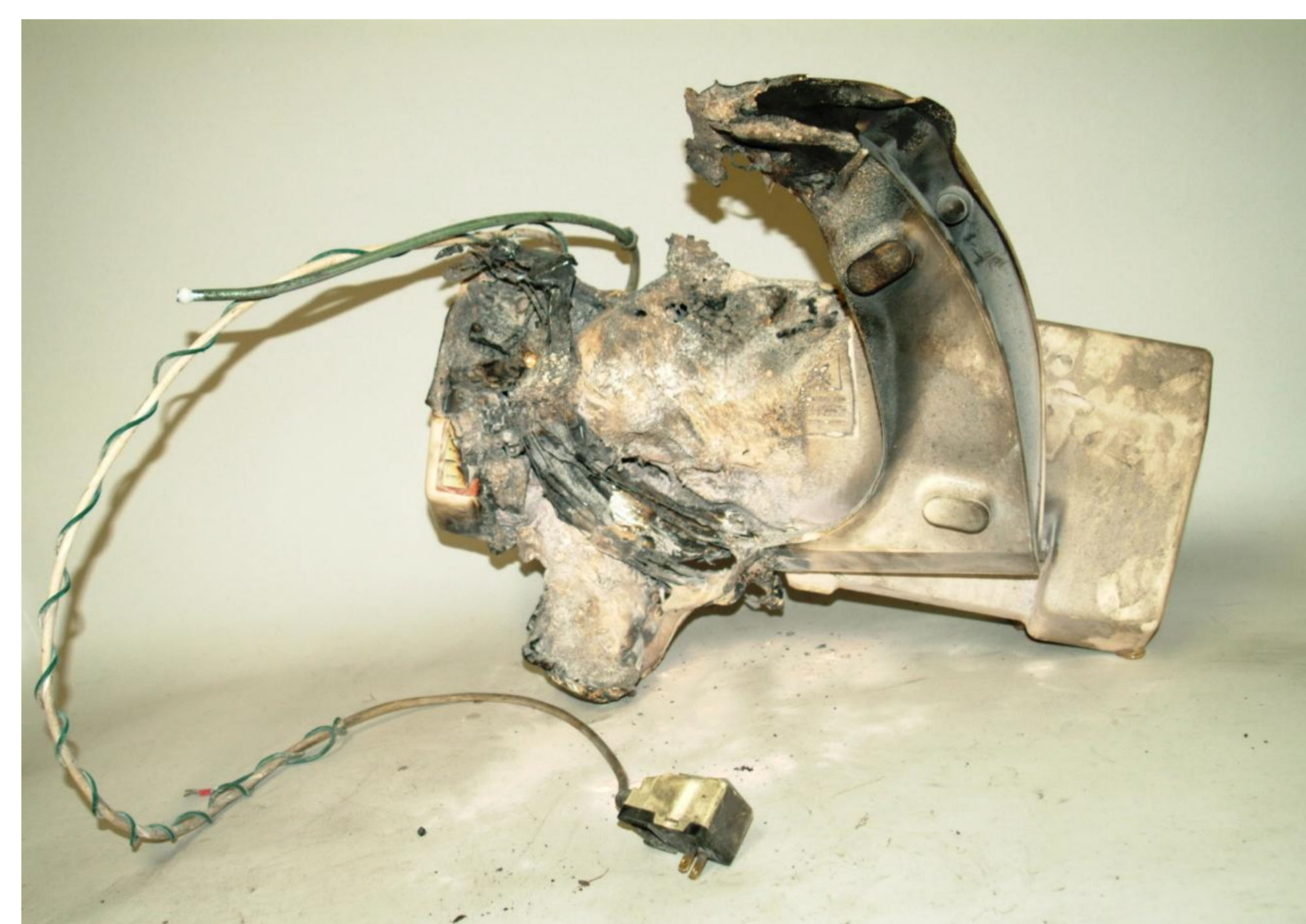
発火した温水洗浄便座

便座取付部分の電源コードが開閉時の屈曲により半断線状態となって熱をもったために発火し、樹脂製カバーなどに着火したものです。