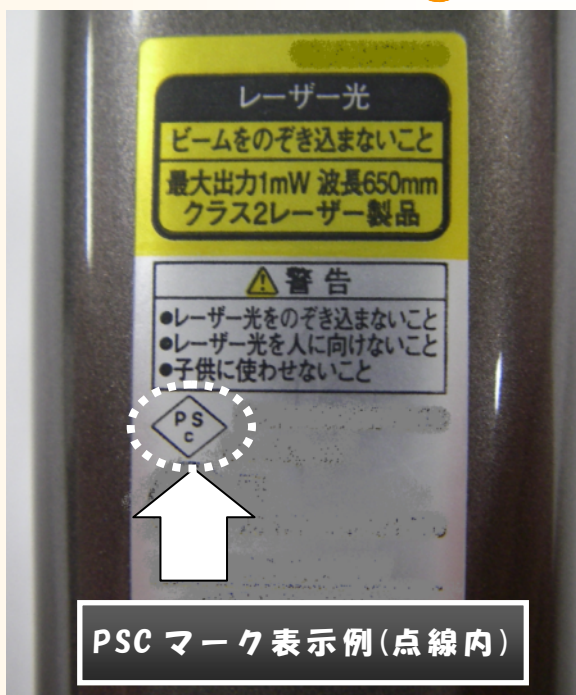
PSC マーク表示例(点線内)